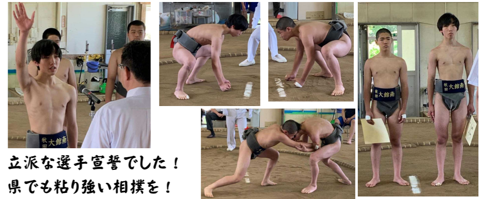
立派な選手宣誓でした！ 県でも粘り強い相撲を！