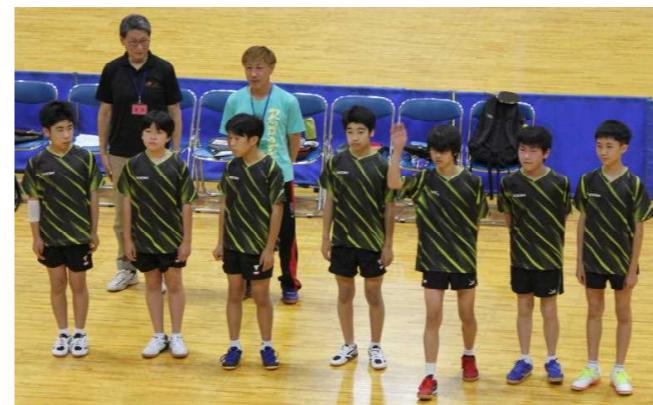
何試合も何試合も戦い続ける、その体力と精神力で、どんなことも乗り越えられる！

個人戦は惜しくも3回戦敗退。団体では5番手まで全員出場し驚異の粘りを見せるも、予選リーグ敗退。メンバー7名全員が力を出し切りました。