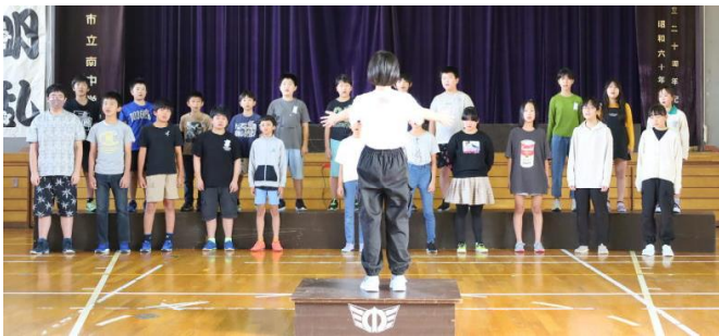
↑ 南小5・6年生による「にじ」 友達に語りかけるように歌いました。

この日は、南中祭や学習発表会で歌う合唱曲を披露しました。中学生も小学生も緊張している様子でしたが、これまで練習してきたことを意識して合唱できました。お互いに刺激を受け、感想発表でたたえ合い、本番に向けてまた更にならばろうという気持ちを高めることができました。本番、どうぞご期待ください！