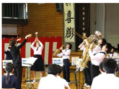
10/19 60周年記念集会【吹奏楽演奏 ～ ようこそ、先輩】