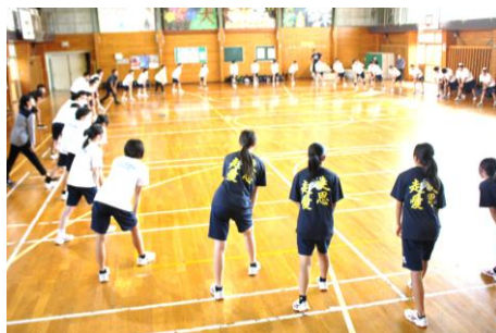
9/4 大北秋季激励会の円陣