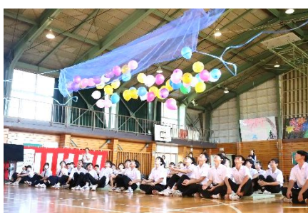
10/4 南中祭クロージング